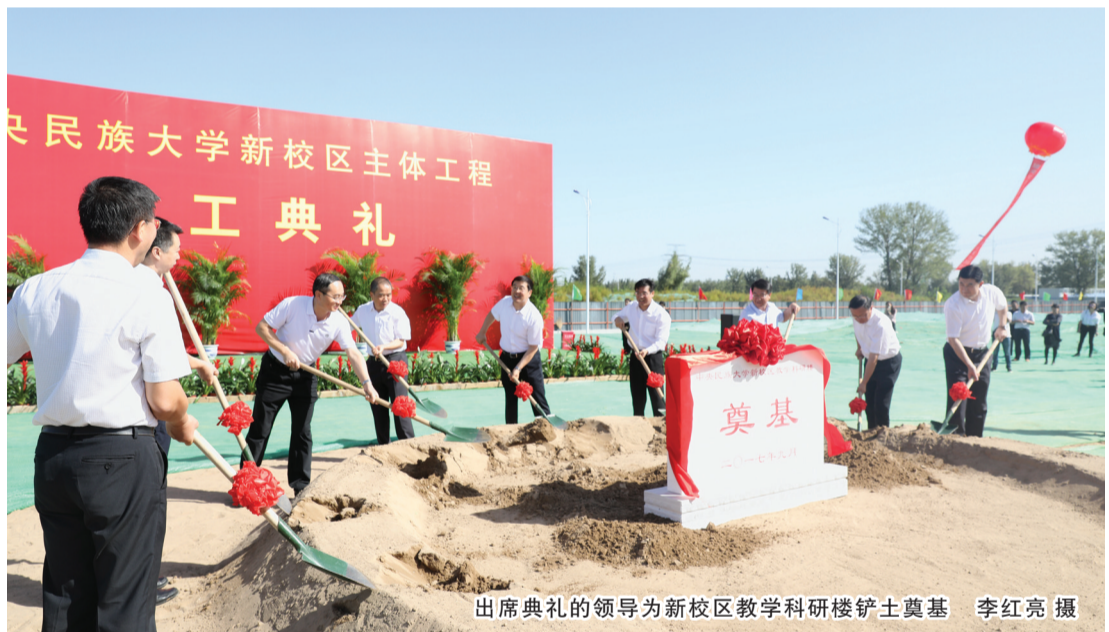
出席典礼的领导为新校区教学科研楼铲土奠基

据介绍，此次开工的教学科研楼总面积23800平方米，总投资1.24亿元。2018年，拟建筑面积14万平方米，投资6.58亿元。2019年，拟建筑面积16万平方米，投资7.63亿元。建成后，建筑面积达到38万平方米，拟于2021年投入使用。