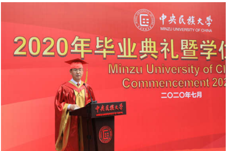
亲爱的毕业生同学们、老师们、家长们、家长们：你们好！

今天，我们在典礼的大礼堂前举行2020年“云毕业典礼”，全体毕业生同学们第一次不用抢票就可以参加全校的毕业典礼，成为师哥师姐眼中“别人家的孩子”；天各一方的我们第一次在云端聚首，成为你们“最in”的民大记忆；毕业生同学们、老师们、家长们、家长们，以及所有关心民大的领导和朋友们第一次这么多人共同见证你们的毕业，成为你们激昂的《青春诗会》。这些无奈中的“小确幸”，将会成为你们未来“话说当年”的“梗”。