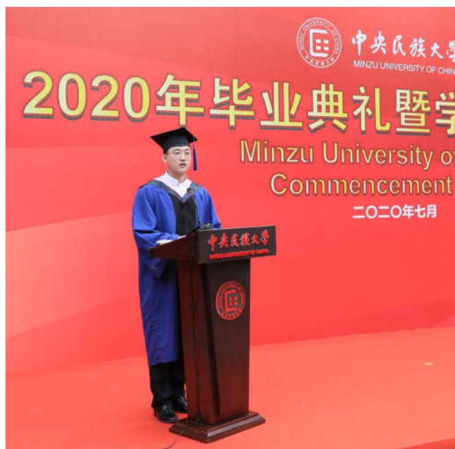
尊敬的各位老师、各位校友，亲爱的同学们：