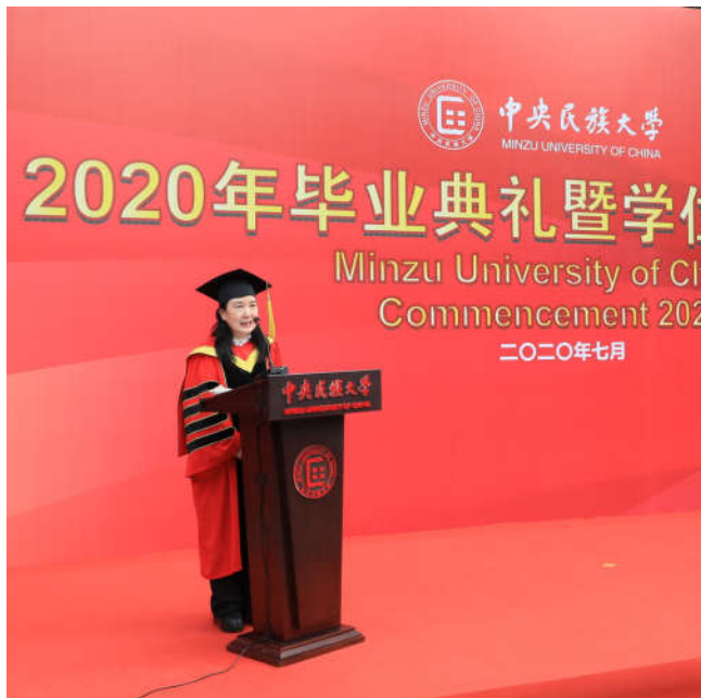
尊敬的张京泽书记、黄泰岩校长、尊敬的同仁和毕业生的家长们、亲爱的同学们：